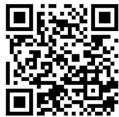
報名網址二維條碼掃描

本說明會將依個人資料保護法及相關法令之規定，依隱私權保護政策，蒐集、處理及合理使用您的個人資料，報名資料僅供本說明會使用。